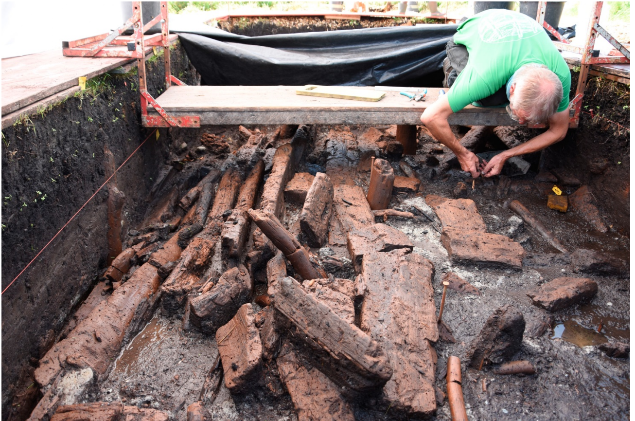
Aktuelle Befunde (A. Probst-Böhm/LAD)