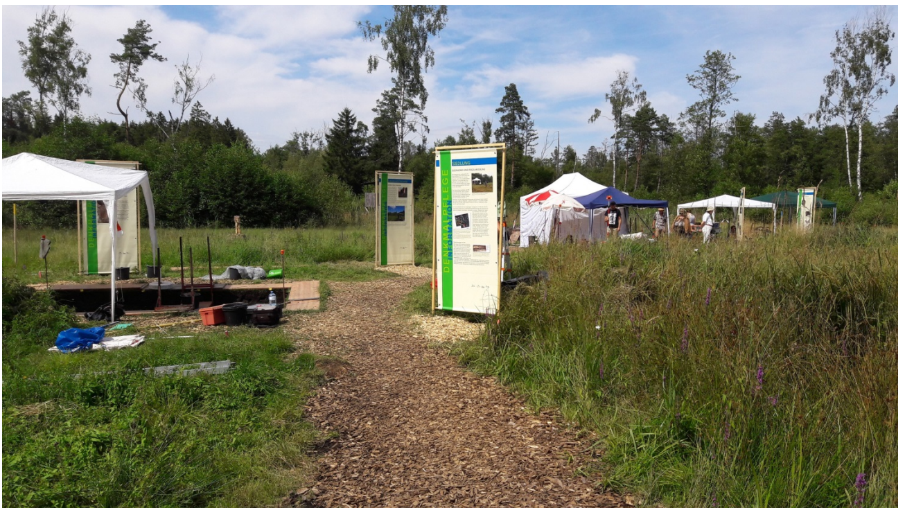
Grabung (LAD, A. Probst-Böhm)