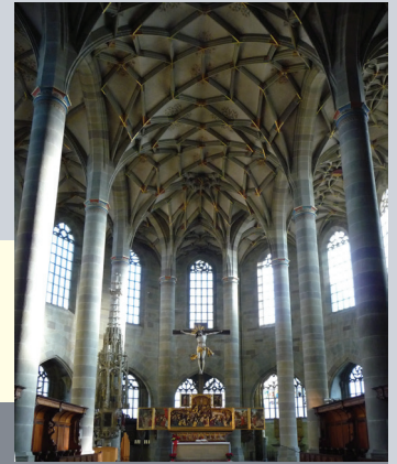
Blick in den Chor