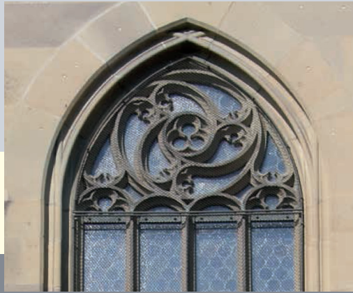
Fenstermaßwerk, Chor, Obergaden