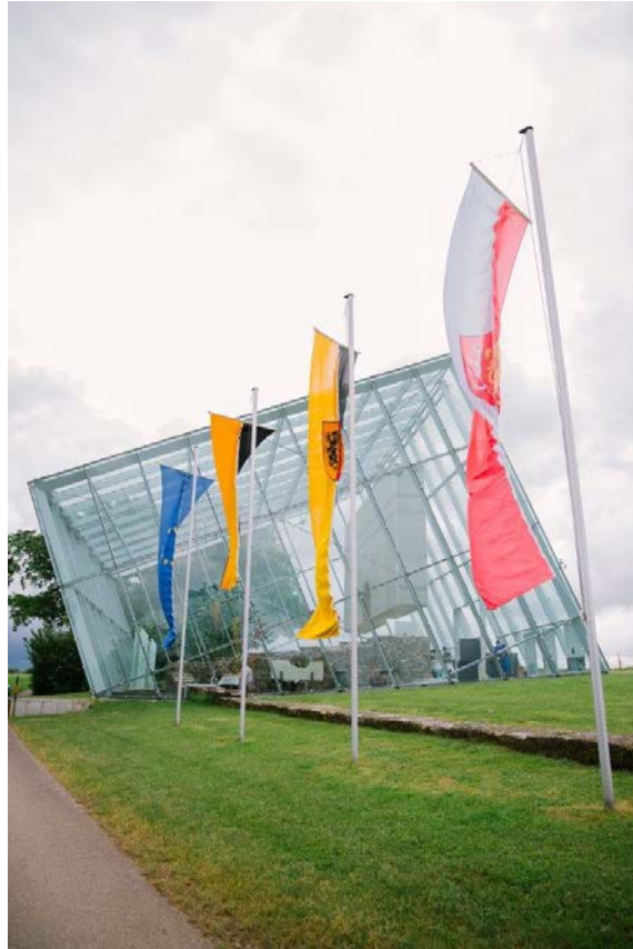
Schutzhause Limestor Dalkingen in Rainau (Ostalbkreis)