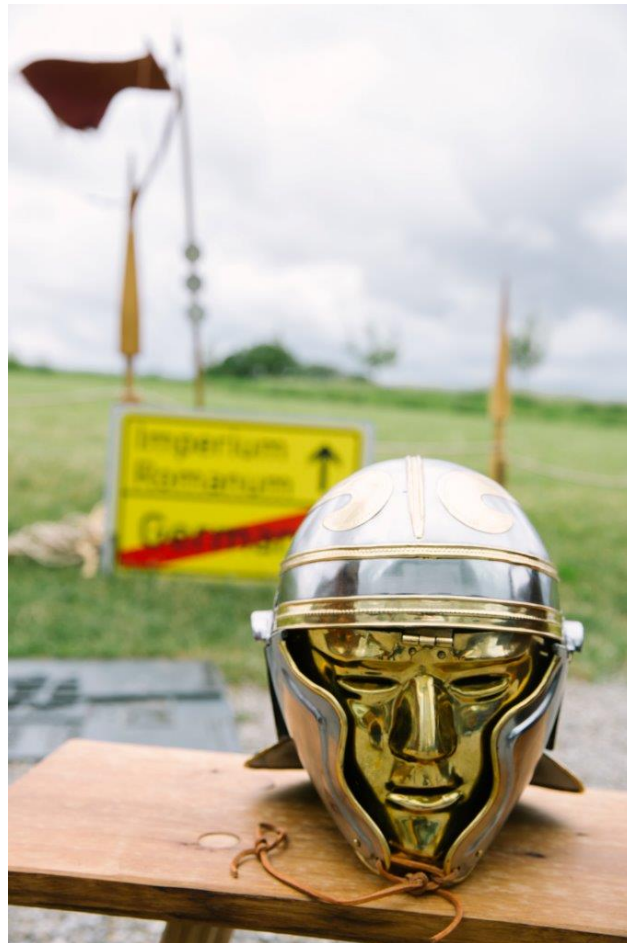
Kopie eines römischen Maskenhelmes, der beim Limestor Dalkingen vor über 40 Jahren gefunden wurde